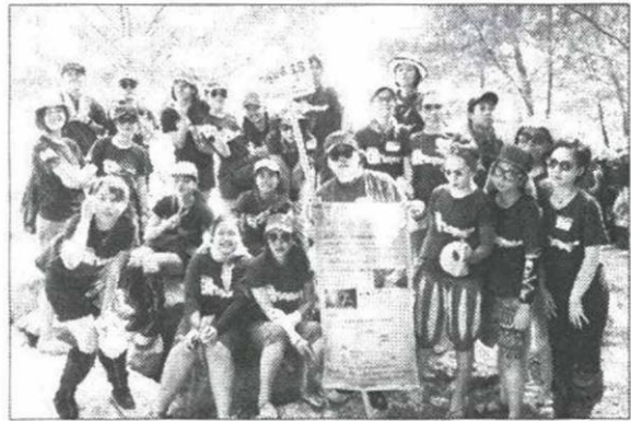
ระดมสมองกับกิจกรรมเสริมความรู้คู่ป่าชายเลน