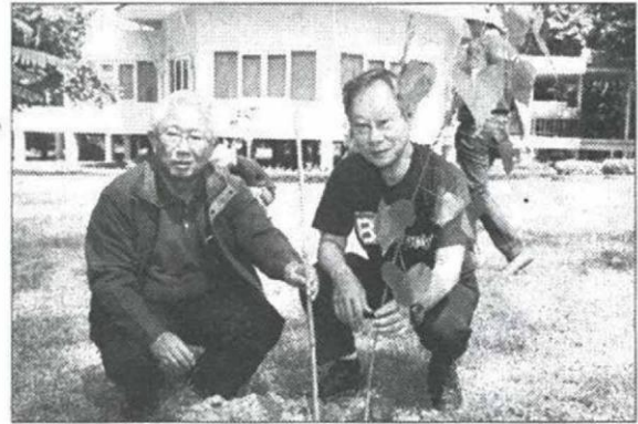
ร่วมปลูกต้นไม้ บริเวณอุทยานสิ่งแวดล้อมนานาชาติสิรินธร