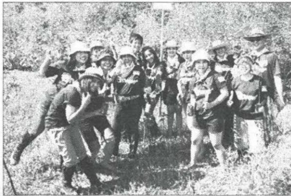
ร่วมแรงร่วมใจปลูกป่าชายเลน