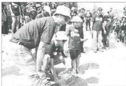
ปล่อยปูม้าคืนสู่ท้องทะเล