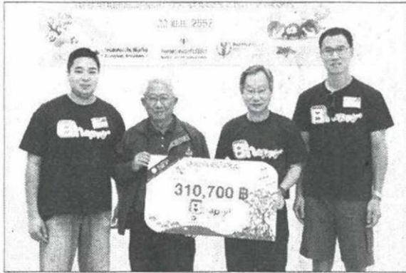
มอบเงินสนับสนุนแก่อุทยานสิ่งแวดล้อมนานาชาติสิรินธร