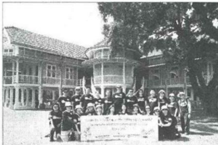
ผู้บริหารจาก 3 องค์กร ณ พระราชนิวเดนมฤคทายวัน