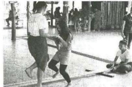
สนุกกับการเล่นลาวกระทบไม้