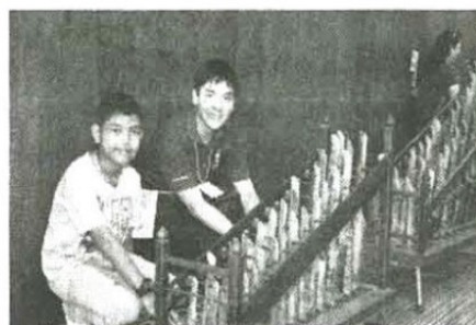
ลองเล่นดนตรีไทย