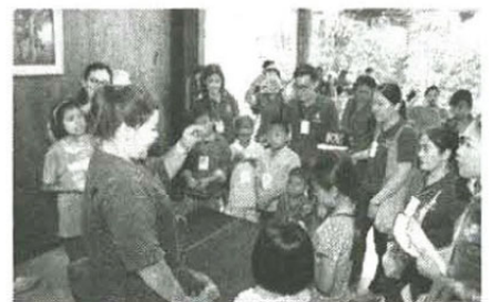
จากดินก้อนกลมๆ บัดนี้จนกลายเป็นตุ๊กตาช้าง