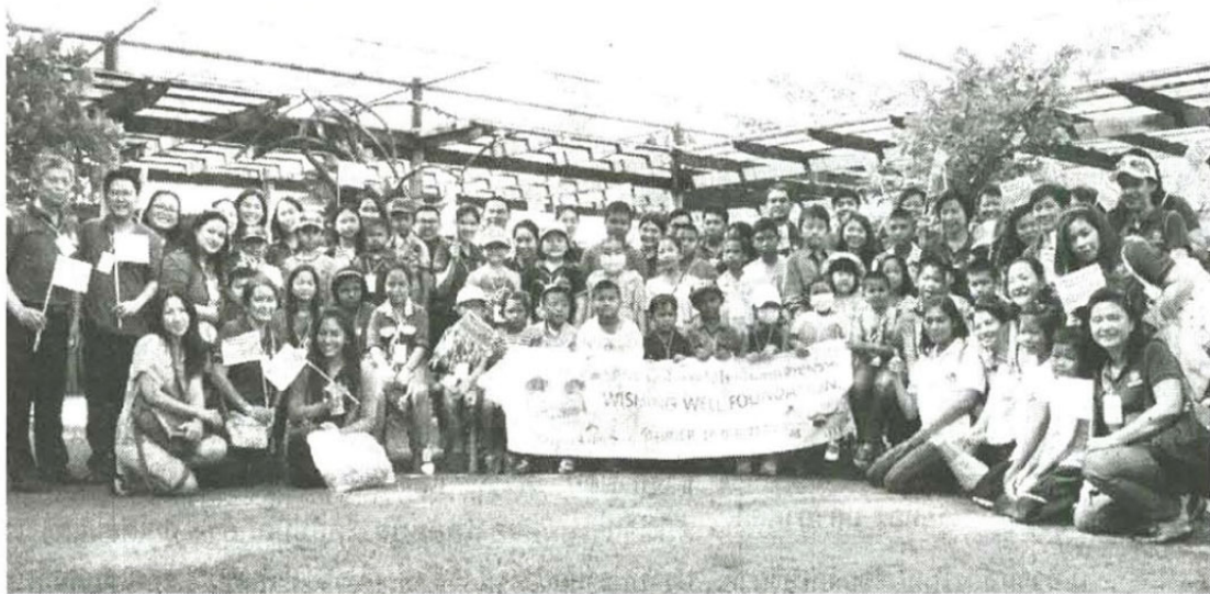
พี่ๆ น้องๆ ถ่ายภาพหมู่ร่วมกัน