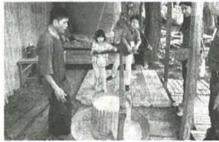
พี่น้องช่วยกันสีข้าว