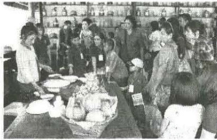
ชมสถิติการทำขนมกล้วย