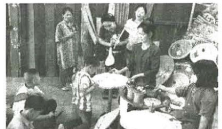
น้องๆ วาดลวดลายบนร่มตามจินตนาการของแต่ละคน

กรุงเทพประกันภัยร่วมกับมูลนิธิสายธารแห่งความหวังจัดกิจกรรมต่างๆ เพื่อสานฝันให้น้องๆ ได้รับความสุขสนุกสนาน และประสบการณ์ที่น่าจดจำมาอย่างต่อเนื่อง โดยในปี 2554 ได้จัดกิจกรรม BKI พาน้องท่องซาฟารีเวิลด์ ปี 2555 กับกิจกรรม BKI พาน้องเที่ยวเขาเขี้ยวพลบุรี ปี 2556 กับกิจกรรม BKI เกี่ยวแขนน้องท่องเขาดิน และในปีนี้ได้จัดกิจกรรม BKI พาน้องชมวิถีไทยในสวนสามพราน ซึ่งบริษัทจะยังคงสานต่อกิจกรรมดีๆ เหล่านี้ในปีต่อๆ ไป