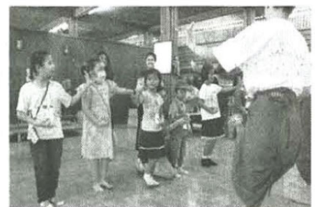
หัดรำไทยกับพี่ๆ ผู้ฝึกสอน