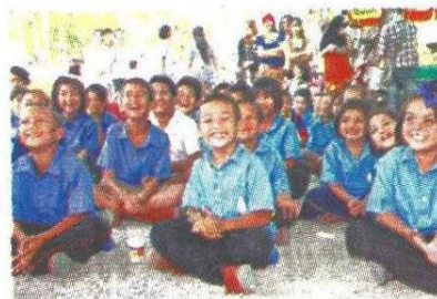
▲เด็ก ๆ สนุกสนานกับกิจกรรมสันทนาการ