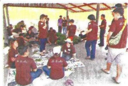
▲พี่ๆ ร่วมกันปรับปรุงแปลงเกษตร