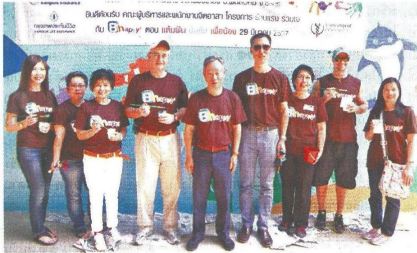
▲ผู้บริหารจาก 3 องค์กร ผนึกกำลังร่วมกันจัดกิจกรรม “ร่วมแรง ร่วมใจ กับ Bhappyy” ตอน แด้มฝัน ปันยิ้ม เพื่อน้อง ครั้งที่ 2