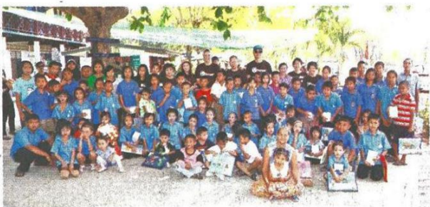
▲ผู้ใหญ่ใจดีร่วมถ่ายรูปกับน้องๆ นักเรียน