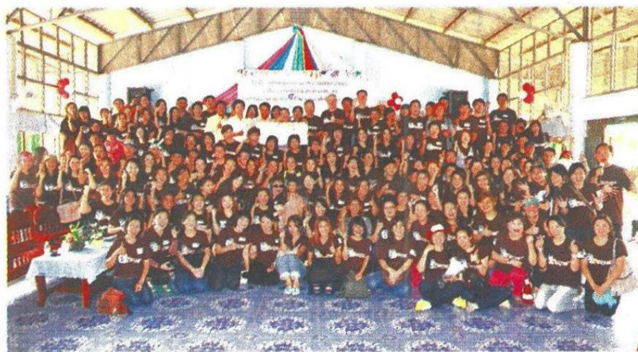
▲ พนักงานจิตอาสาที่ร่วมแรงร่วมใจในกิจกรรมครั้งนี้

สำหรับโครงการ “Bhappy 3 ” เป็นโครงการที่ บมจ.กรุงเทพประกันภัย, บมจ.โรงพยาบาลบำรุงราษฎร์ และ บมจ.กรุงเทพประกันชีวิต ร่วมกันจัดตั้งขึ้นโดยมีวัตถุประสงค์เพื่อให้พนักงานของทั้ง 3 บริษัท ได้มีส่วนร่วมทำกิจกรรมต่างๆ เพื่อประโยชน์ต่อ