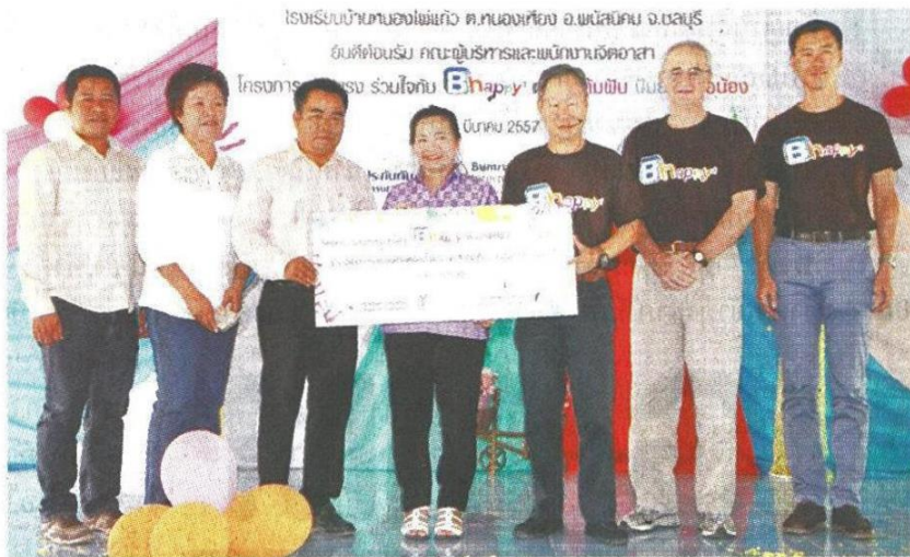
▲ถ่ายภาพร่วมกันเป็นที่ระลึก