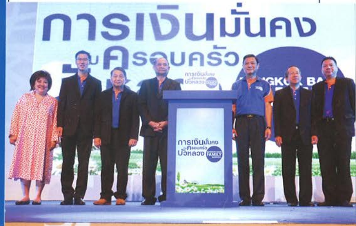
• ผู้บริหารจากทั้ง 5 องค์กรร่วมพิธีเปิดงาน