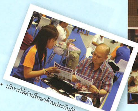
• บริการให้คำปรึกษาด้านประกันภัย