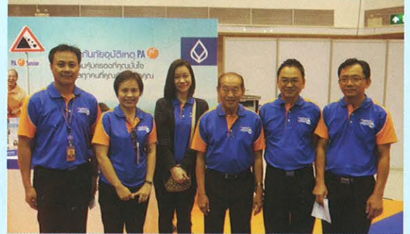
• ผู้บริหารจาก ธ.กรุงเทพ กรุงเทพประกันภัย และกรุงเทพประกันชีวิตพร้อมต้อนรับ

นับเป็นการเปิดตัวงานนี้เป็นงานแรกอย่างสวยงาม ด้วยการตอบรับที่ดีจากผู้เยี่ยมชมงานชาวเหนือกว่า 2,000 คน ก่อนที่จะร่วมฝึกกำลังไปมอบความรู้ความบันเทิงให้แก่ชาวอีสานในเดือนสิงหาคมนี้