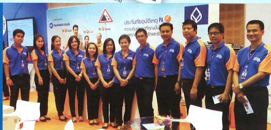
• ทีมงาน จากกรุงเทพประกันภัย จ.เชียงใหม่