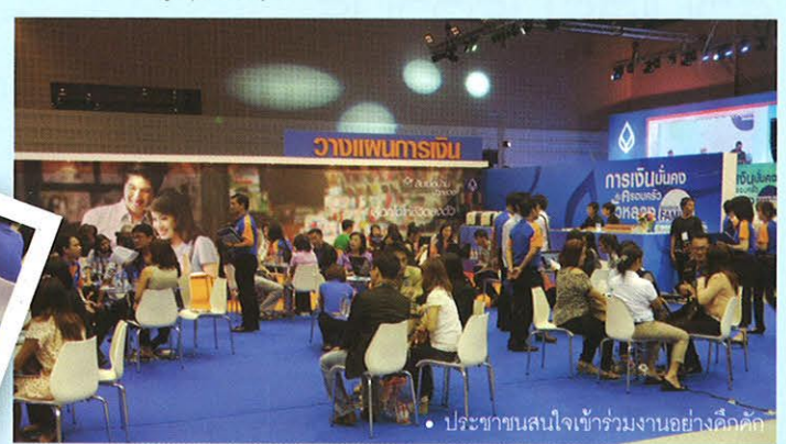
• ประชาชนสนใจเข้าร่วมงานอย่างคึกคัก