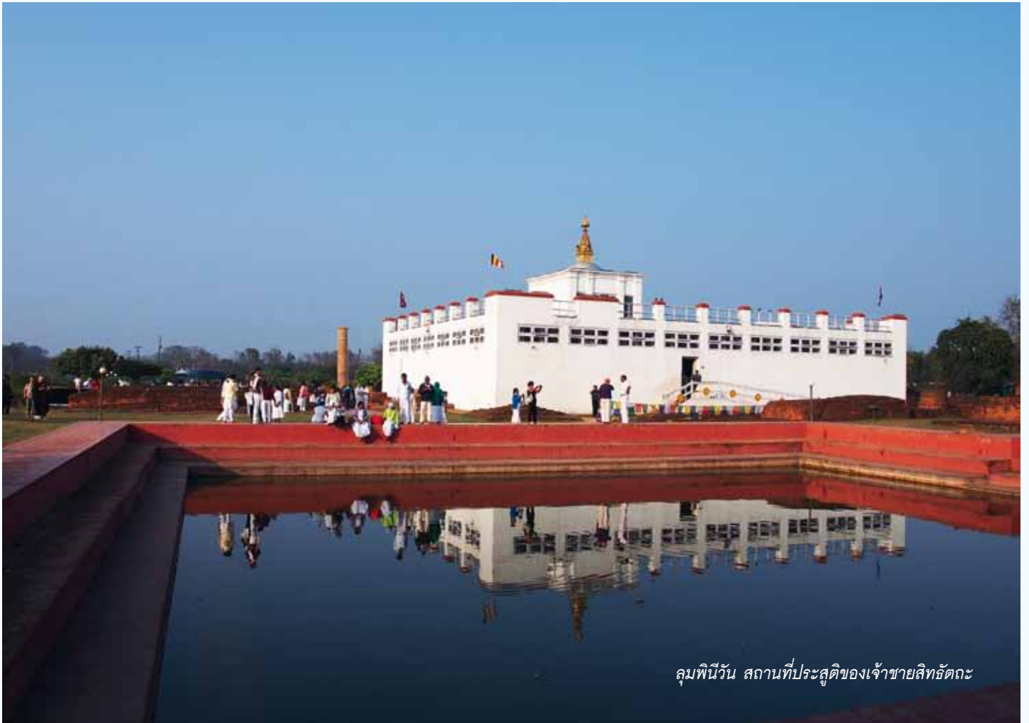
ลุมพินีวัน สถานที่ประสูติของเจ้าชายสิทธัตถะ