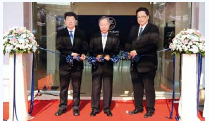
พิธีเปิดสาขานครปฐม