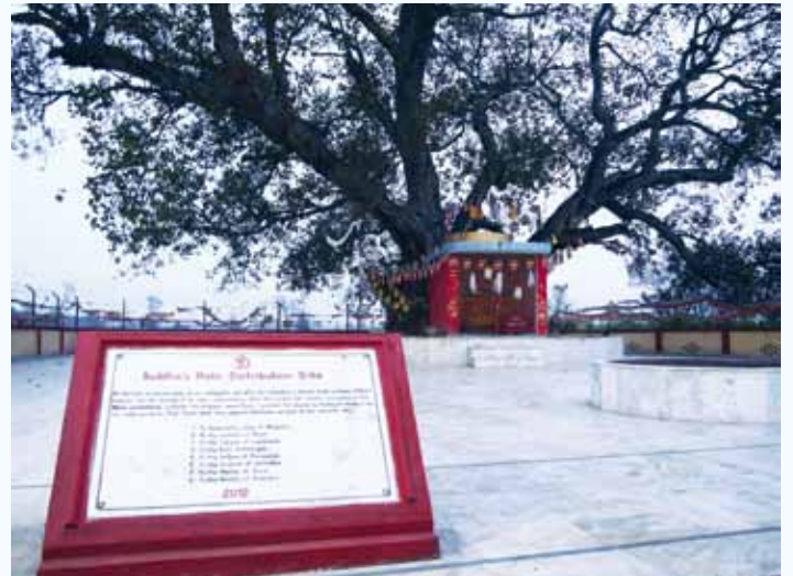
พระแท่นวัชรอาสน์ ได้ต้นพระศรีมหาโพธิ์