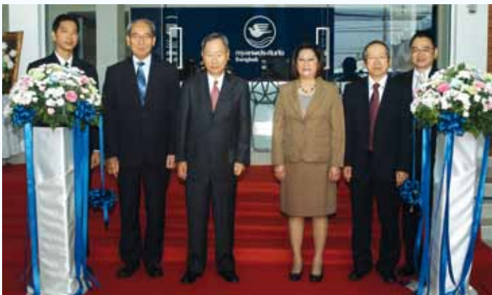
พิธีเปิดสาขาสระบุรี

นอกจากนี้ บริษัทฯ ยังมีการเตรียมเปิดสาขาแห่งใหม่ในภูมิภาคต่างๆ เพิ่มขึ้นอย่างต่อเนื่อง ด้วยหวังเป็นอย่างยิ่งว่าการให้บริการที่ครอบคลุมอย่างทั่วถึงนี้ จะสร้างความอุ่นใจแก่ลูกค้าทุกท่านอย่างใกล้ชิดยิ่งขึ้น ดังสโลแกนที่ว่า “กรุงเทพประกันภัย แคร่คุณทุกอย่างก้าว” ที่เราเชื่อมั่นเสมอมาค่ะ