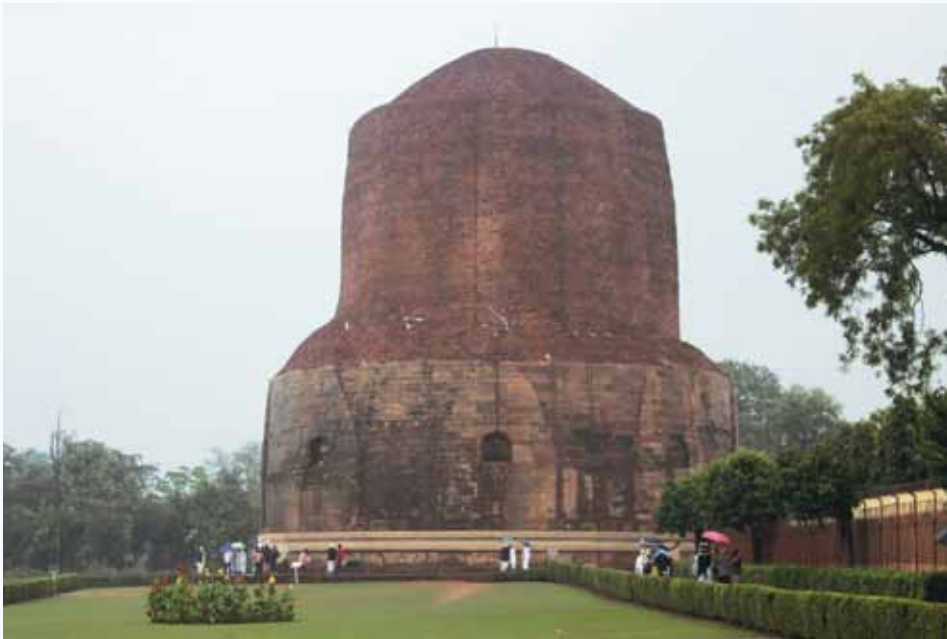
ธัมเมกะสถูป เมืองสารนาถ สถานที่แสดงปฐมเทศนาโปรดปัญจวัคคีย์

แต่พระพุทธเจ้าในคืนก่อนตรัสรู้ มหาวิทยาลัย นาลันทา อดีตมหาวิทยาลัยสงฆ์แห่งแรก ที่ยัง ปรากฏร่องรอยแห่งความยิ่งใหญ่ในอดีต นมัสการ พระคันธกุฎี กุฏิพระพุทธเจ้าบนเขาคิชฌกูฏ และ ชมวัดเวฬุวัน สถานที่พระพุทธเจ้า ทรงแสดงธรรม แก่พระอรหันต์ 1,250 รูป ในวันมาฆบูชา