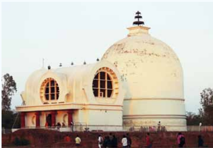
กุสินารา สถานที่ดับขันธปรินิพพาน

กิจกรรมในครั้งนี้ เป็นส่วนหนึ่งของการส่งเสริม การพัฒนาด้านจิตใจให้แก่ผู้บริหารและพนักงาน ได้มีโอกาสศึกษาและเรียนรู้พุทธประวัติจาก สถานที่จริง พร้อมสร้างบุญกุศลครั้งใหญ่แก่ชีวิต ก่อให้เกิดความเลื่อมใสศรัทธาในพุทธศาสนา และ น้อมนำเอาหลักคำสั่งสอนของพระพุทธองค์ มาเป็นแนวทางการแห่งการดำเนินชีวิตและใช้ ประโยชน์ในการทำงานต่อไป