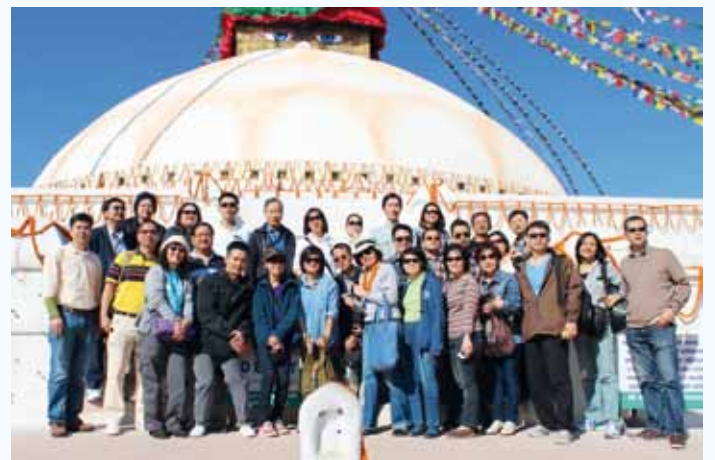
คณะผู้บริหารร่วมสักการะสถูปพุทธนาค ประเทศเนปาล