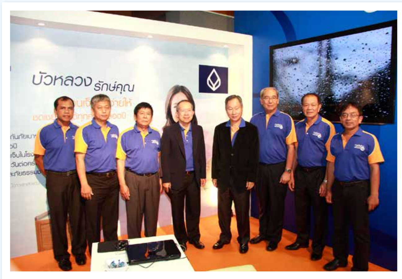
ผู้บริหารกรุงเทพประกันภัย เข้าร่วมงานการเงินมั่นคงกับครอบครัวบัวหลวง