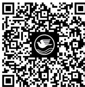
QR Code แบบ 56-1 One Report ประจำปี 2566