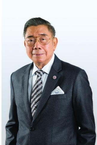
นายกongเอก เปล่งศักดิ์ ประกาศเกสัช