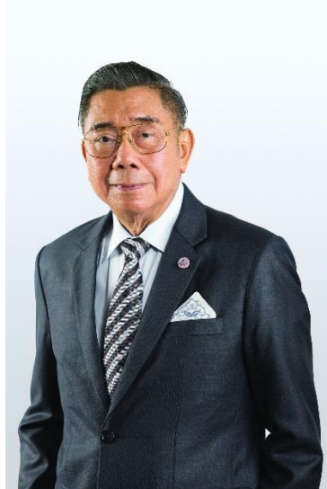
นายกองเอก เปล่งศักดิ์ ประกาศเกสิทธิ์